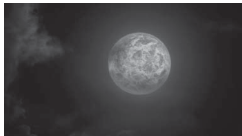
Кадр из кинофильма «Меланхолия» (2011 г., режиссер Ларс фон Триер)

Закон художественного парадокса составляет стержень содержания таких знаменитейших живописных полотен, как «Сад наслаждений» Иеронима Босха, «Последний день Помпеи» Карла Брюллова, «Пир королей» Павла Филонова. В кинематографии выдающимся художественным парадоксом может быть названа сцена появления таинственной планеты в «Меланхолии» Ларса фон Триера (2011). Во весь экран сияет и переливается дивными красками, в совершеннейшей форме круга, под красивейшую и томительную музыку Вступления к «Тристану и Изольде» Вагнера планета Меланхолия, вплотную подходящая к Земле. Кадр — воплощение и полной Красоты, и неминуемой гибели всех героев. Чем дальше расходятся острия «ножниц» специального