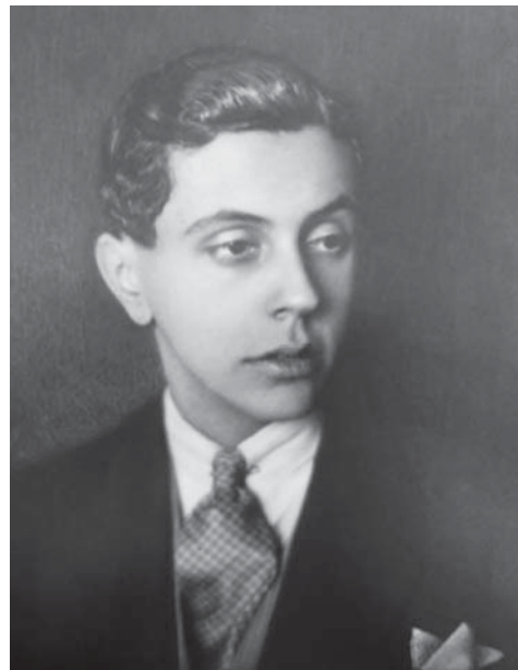
В. Дукельский. 1924.

Первый визит Владимира Дукельского (1903–1969) в Лондон состоялся в 1925 году. Композитор к этому времени совершил путь эмигранта из Киева, где обучался в консерватории у Р. Глиэра и Б. Яворского, через Одессу и Константинополь в США, а затем — в Париж. Период пребывания в Турции оказался первым для Дукельского погружением в среду русского зарубежья: работая в клубе «Русский Маяк», он познакомился с Б. Кохно, Н. Кошиц, П. Сувчинским и многими другими музыкантами, художниками, литераторами. Контакты композитора с русской эмиграцией расширились в США, куда его семья переехала осенью 1921 года. По предложению Артура Рубинштейна Дукельский написал Фортепианный концерт — свой «паспорт в Париж» (таково символичное название англоязычных мемуаров композитора [7]) и в кампанию «Русских сезонов» С. Дягилева. Премьера дебютного балета Дукельского «Зефир и Флора» состоялась в Монте-Карло в апреле 1925 года, а 12 ноября — на сцене лондонского Колизея с новыми декорациями Ж. Брака и масками О. Мессела. Пребывание в Лондоне — важный для Дукельского этап включения в музыкальную жизнь города, давшую новые импульсы его творчеству.