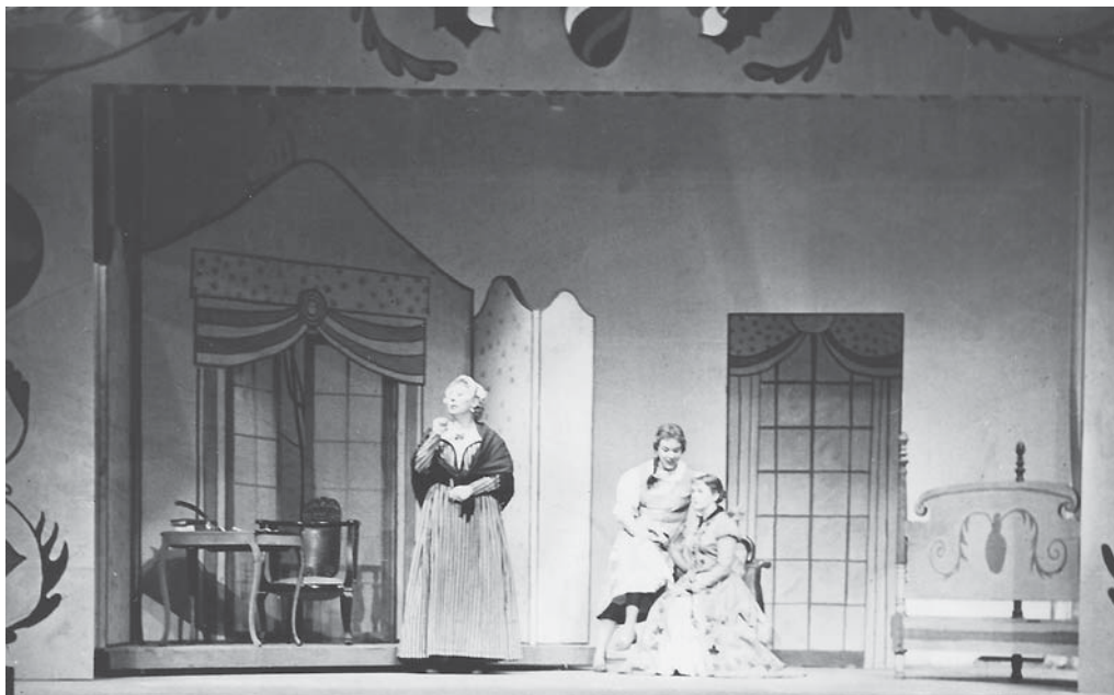
Фото первой постановки оперы «Барышня-крестьянка».

продолжительности звучания, номерную по структуре и замыкающуюся моралите — обращенным к публике ансамблем всех певцов-актеров. Бытовой комический сюжет, использование русского литературного первоисточника (хотя и из другой эпохи), камерность и явная ориентация на ретроспективную стилевую модель характерна и для оперы Уолтона «Медведь» по А. Чехову (1967), обозначенную автором как «экстраваганца».