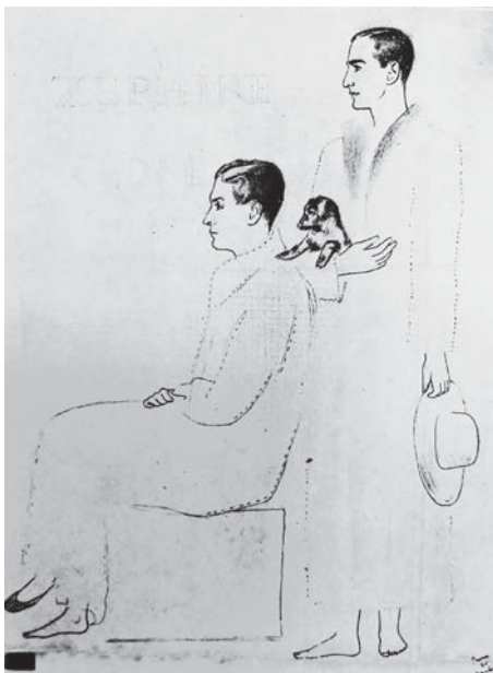
П. Прюна. Портрет В. Дукельского и Б. Кохно, опубликованный в журнале «Вог» (октябрь 1925 г.)

В Лондоне середины 1920-х, как известно, процветал мюзик-холл. К глубокой досаде Дягилева многие из артистов его труппы, оказавшись в Британии, пользовались возможностью дополнительного заработка в эстрадных театрах — вотчине импресарио Ч. Кокрана, который во время показа «Зефира» в Лондоне предложил Дукельскому сотрудничество в музыкальной комедии. Вероятно протекцию молодому композитору, уже успевшему на краткое время включиться в музыкальную индустрию США, обеспечил Л. Мясин, который принимал участие в постановках хореографических номеров для лондонского мюзик-холла.