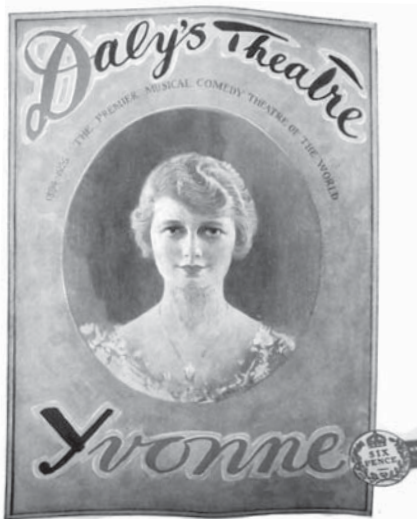
Программа музыкальной комедии «Ивонна». Дэйлиз-театр, 1926.

Тогда же в Лондоне через семью Ситуэллов, чей дом стал временным пристанищем Дукельского, композитор познакомился и сблизился с Уильямом Уолтоном (1902–1983). В письме к матери, отправленном к Рождеству 1925 года, композитор поспешил поделиться своим впечатлением от первых дней дружбы: «Он — тихий, спокойный, невероятно добрый человек и притом с очень острым умом и незаурядными муз[ыкальными] способностями. Мне с ним было легко и свободно» 1 . В 1930-е годы