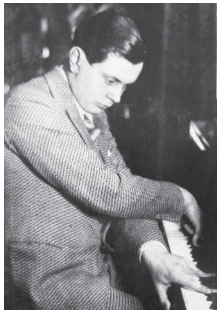
В. Дукельский. Лондон, сер. 1920-х.

Еще до прибытия дягилевской труппы в Англию лондонская пресса представила Дукельского весьма оптимистично: критики писали о новом открытии, оглушительном успехе, крепкой русской школе, пользуясь достаточно яркими рекламными средствами. Портрет ком-